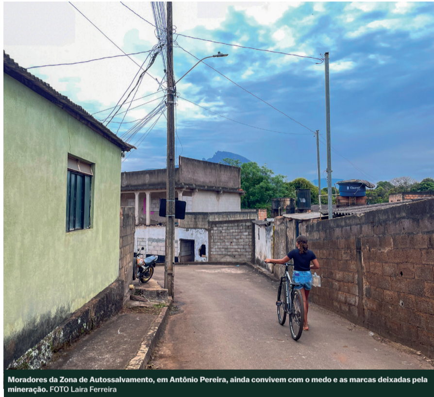
Moradores da Zona de Autossalvamento, em Antônio Pereira, ainda convivem com o medo e as marcas deixadas pela mineração.

Após o rompimento da barragem de Fundão, o silêncio deixado pela lama ainda ecoa em Antônio Pereira, um distrito a cerca de 15 km de Bento Rodrigues. A lembrança do crime ambiental marca a memória dos moradores. Casas vazias e crianças brincando debaixo de placas de rota de fuga, além de barulho intenso causado pelos caminhões que cruzam as ruas do distrito, colaboram para a sensação de esquecimento vivida, dia após dia, por uma comunidade que há uma década tenta ser ouvida.