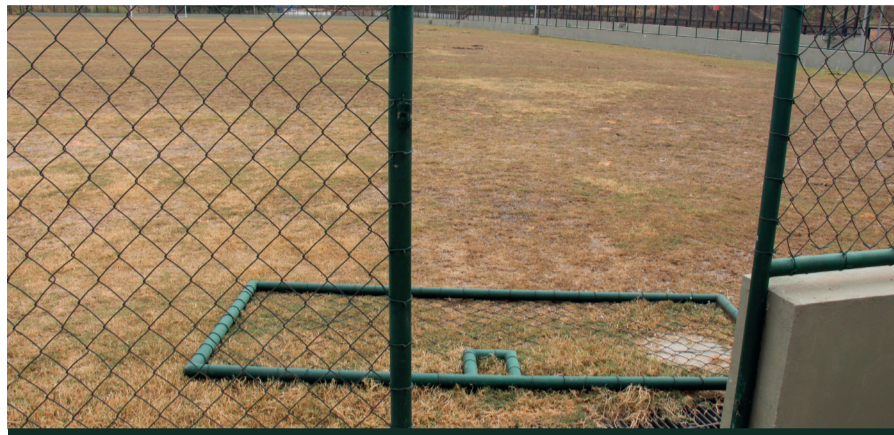
Recém inaugurado, campo de Paracatu tem sinais de abandono pela Samarco e prefeitura, time local se desloca para Padre Viegas em dias de jogos.

BENTO RODRIGUES e PARACATU DE BAIXO, MONSENHOR HORTA e SANTA RITA DURÃO