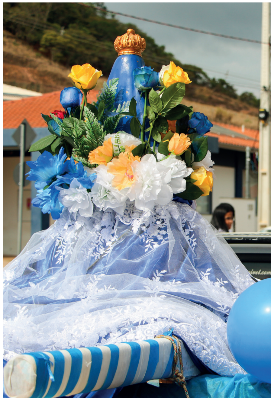
Decoração para a carreata de Nossa Senhora Aparecida, no reassentamento de Paracatu, em 12/10/2025.

Uma forma de manter a identidade de Paracatu viva é a celebração de festas tradicionais, que reúne os moradores em momentos de fé e resistência. A Igreja de Santo Antônio, que ainda carrega as marcas da lama na fachada, é um dos principais motivos de ida dos moradores ao subdistrito, para manter viva a conexão com a terra. Durante a comemoração de Nossa Senhora Aparecida, Seu Nié mostrou sentir na pele a importância dessas manifestações para a união da comunidade. A memória coletiva de Paracatu resiste nessas festas religiosas, ao buscarem um resgate cultural que não vem junto com o novo acordo e com os reassentamentos.