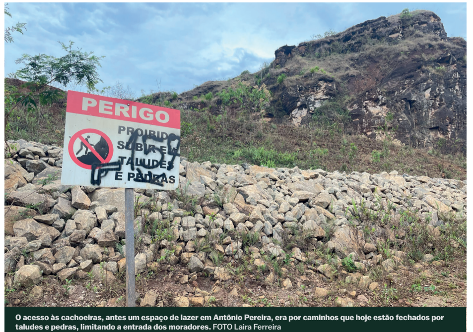
O acesso às cachoeiras, antes um espaço de lazer em Antônio Pereira, era por caminhos que hoje estão fechados por taludes e pedras, limitando a entrada dos moradores.

Atualmente, a comunidade de Antônio Pereira conta com a Assessoria Técnica Independente (ATI) como aliada à sua luta pela reivindicação de direitos. Por meio de eleição popular, o Instituto Guaicuy foi escolhido em fevereiro de 2021 para desempenhar o papel de acolher e mobilizar os moradores locais na luta pela reparação integral. A Assessoria começou a atuar apenas em dezembro de 2022, demora causada pela falta de liberação dos recursos, por parte da Vale, para o início dos trabalhos. Sobre o rompimento de Fundão, até hoje os moradores do distrito não contam com uma ATI para assessorá-los, reflexo da demora do reconhecimento de Antônio Pereira como comunidade atingida.