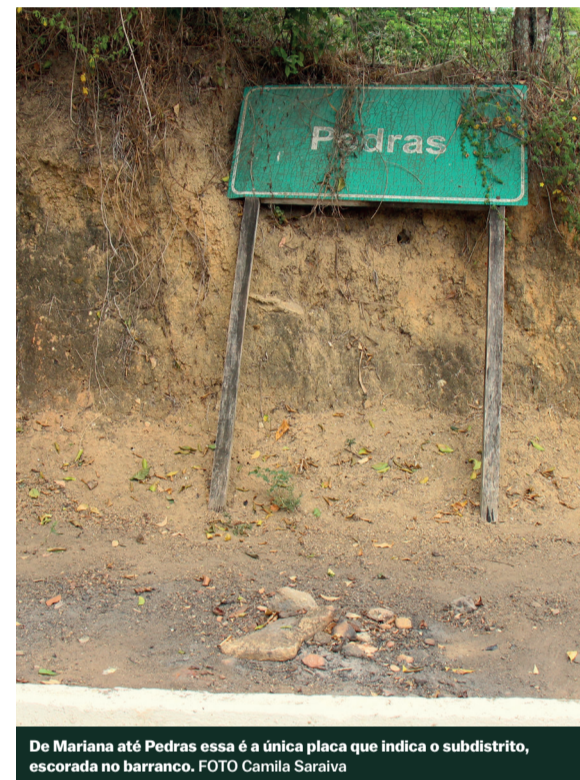
De Mariana até Pedras essa é a única placa que indica o subdistrito, escorada no barranco.