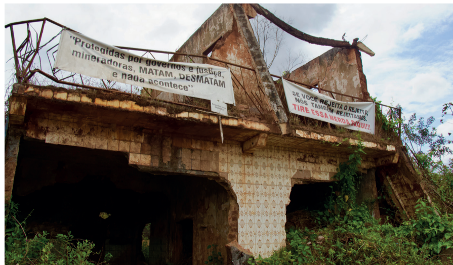
Faixas colocadas por pessoas atingidas em Bento Rodrigues cobram respeito aos direitos das famílias e criticam a atuação das mineradoras.

Enquanto o processo de desapropriação avança, as famílias seguem cobrando que o direito a não-permuta, previsto nas diretrizes homologadas e reafirmado na Carta Denúncia, seja respeitado. Para elas, essa é a garantia de que o vínculo com o território não será rompido. “A gente vai lutando pra ver até onde vai”, diz Simária.